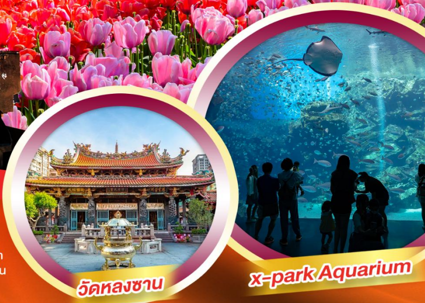
วัดทองซาน