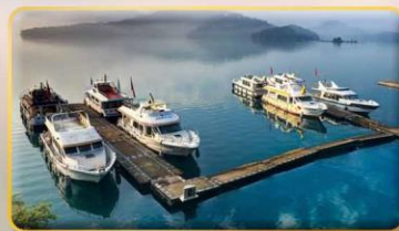
ล่องเรือชมทะเลสาบสุริยันจันทรา