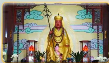
วัดพระถังซำจั๋ง