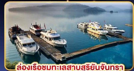
ล่องเรือชมทะเลสาบสุริยอันจินตรา