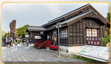
หมู่บ้านฮิโนกิ