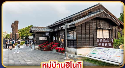
หมู่บ้านฮินโก

"ไทเป" มรดกแห่งเมืองสีกัน เที่ยวจุใจ เซ็คอินจุดไฮไลท์