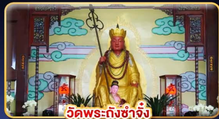
วัดพระถังซำจั๋ง