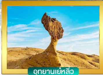
อุทยานเยลิว