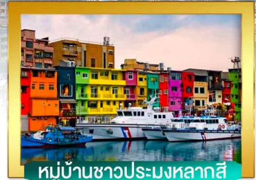
หมู่บ้านชาวประมงหลากสี