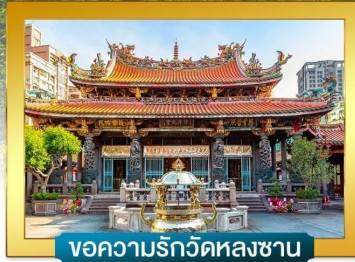
ขอความรักวัดหลงซาน