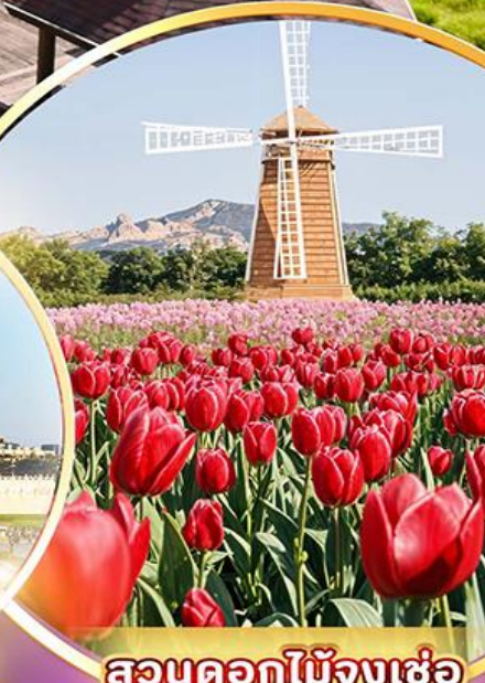
สวนดอกไม้จางเซ่อ