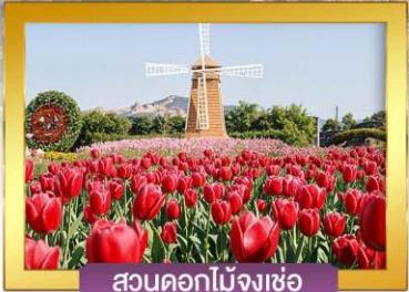
สวนดอกไม้งเซ่อ