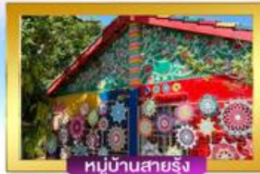
หมู่บ้านสายรุ้ง