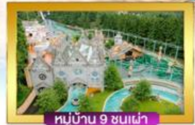
หมู่บ้าน 9 ชั้นฟ้า