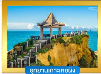
อุทยานเกาะเหอผิง