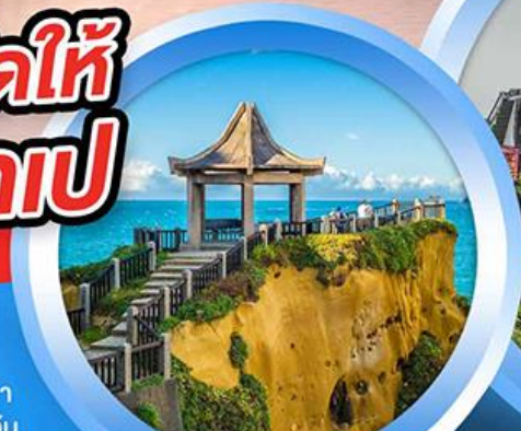
อุทยานเกาะเหอผิง