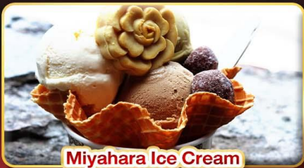
Miyahara Ice Cream