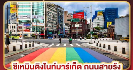
ซีเหมินติงไนท์มาร์เก็ต ถนนสายรุ้ง