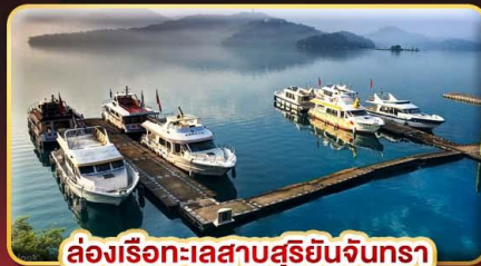
ล่องเรือทะเลสาบสุริยจันทร์