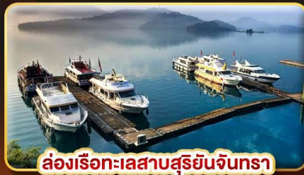
ส่องเรือทะเลสาบสุริยจันทร์