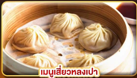
เมนูเสี่ยวหลงเปา