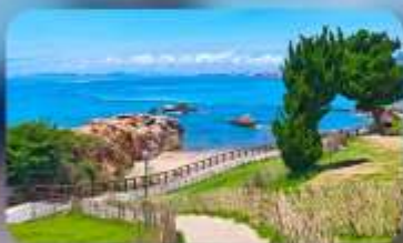
เกาะสี่เหลี่ยมเต่า