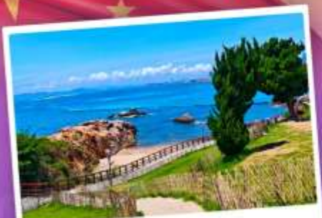
เกาะสี่งมายเต่า

เที่ยวชิงเต่า เมืองทะเลสุดชิล ครบทั้งกิน เที่ยว ถ่ายรูป