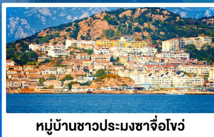
หมู่บ้านชาวประมงซาจี้โจว