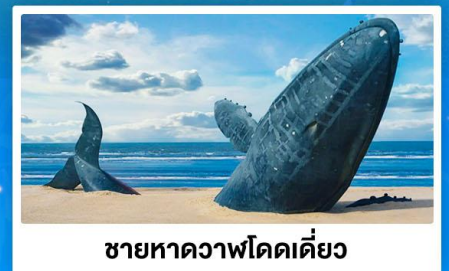
ชายหาดวาฬโดดเคื่อง