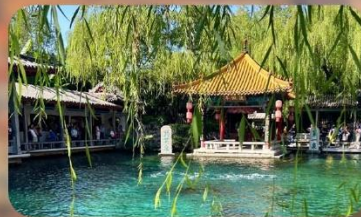
พิพิธภัณฑ์เบียร์ซิงเต่า