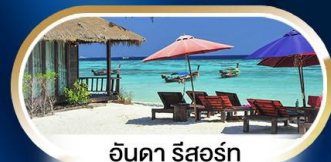
อังคา รีสอร์ท