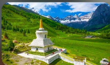
กุเวาสีดรุณี