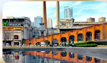
ตงเจียวจื่ออี้