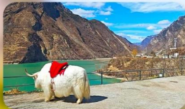
กะเลสาบเต๋อซี