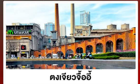
ตงเจียวจ้ออ๋อ