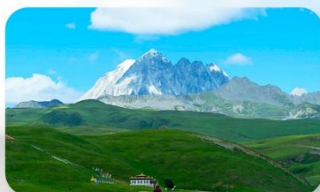
ทุ่งหญ้าด่าง