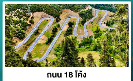
ถนน 18 โค้ง