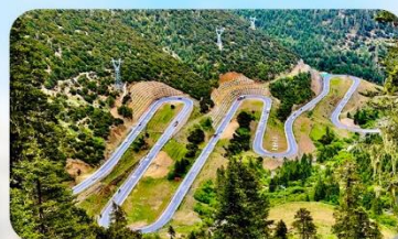
ถนน 18 โค้ง