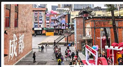
ตงเจียวจ้ออี้