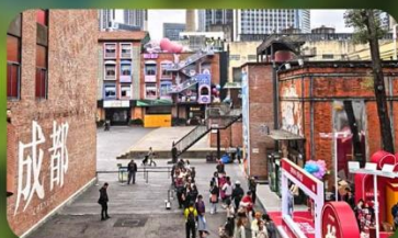
ตงเจียวจ้ออ๋อ