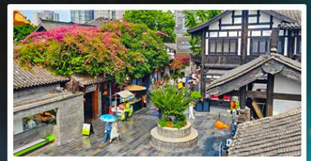
ถนนชอยกวางชอยแควบ