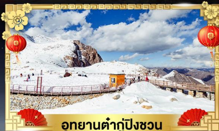
อุทยานตำกู่ปิงชเวน