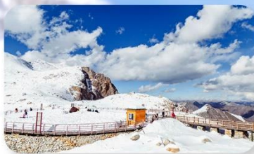
อุทยานต้ากู่ปิงชว่น