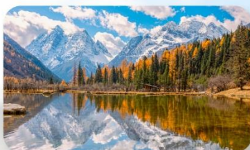
สี่ครุณี