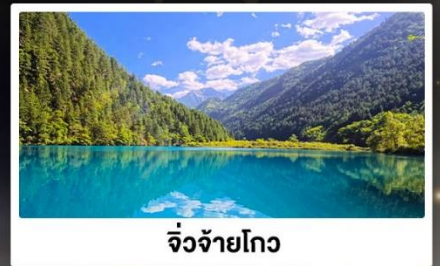
จิ้งจ้ายโกว