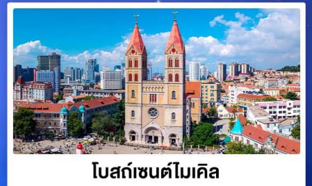
โบสถ์เซนต์โมเคิล