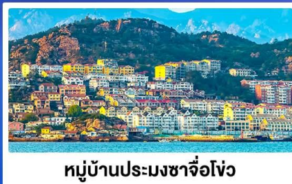
หมู่บ้านประมงซาโจว