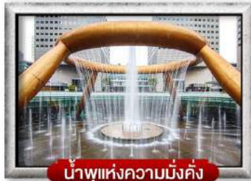
น้ำพุแห่งความมั่งคั่ง