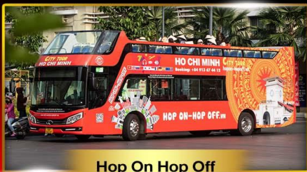
Hop On Hop Off