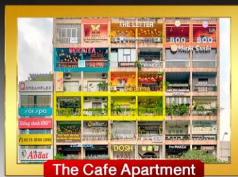
The Cafe Apartment