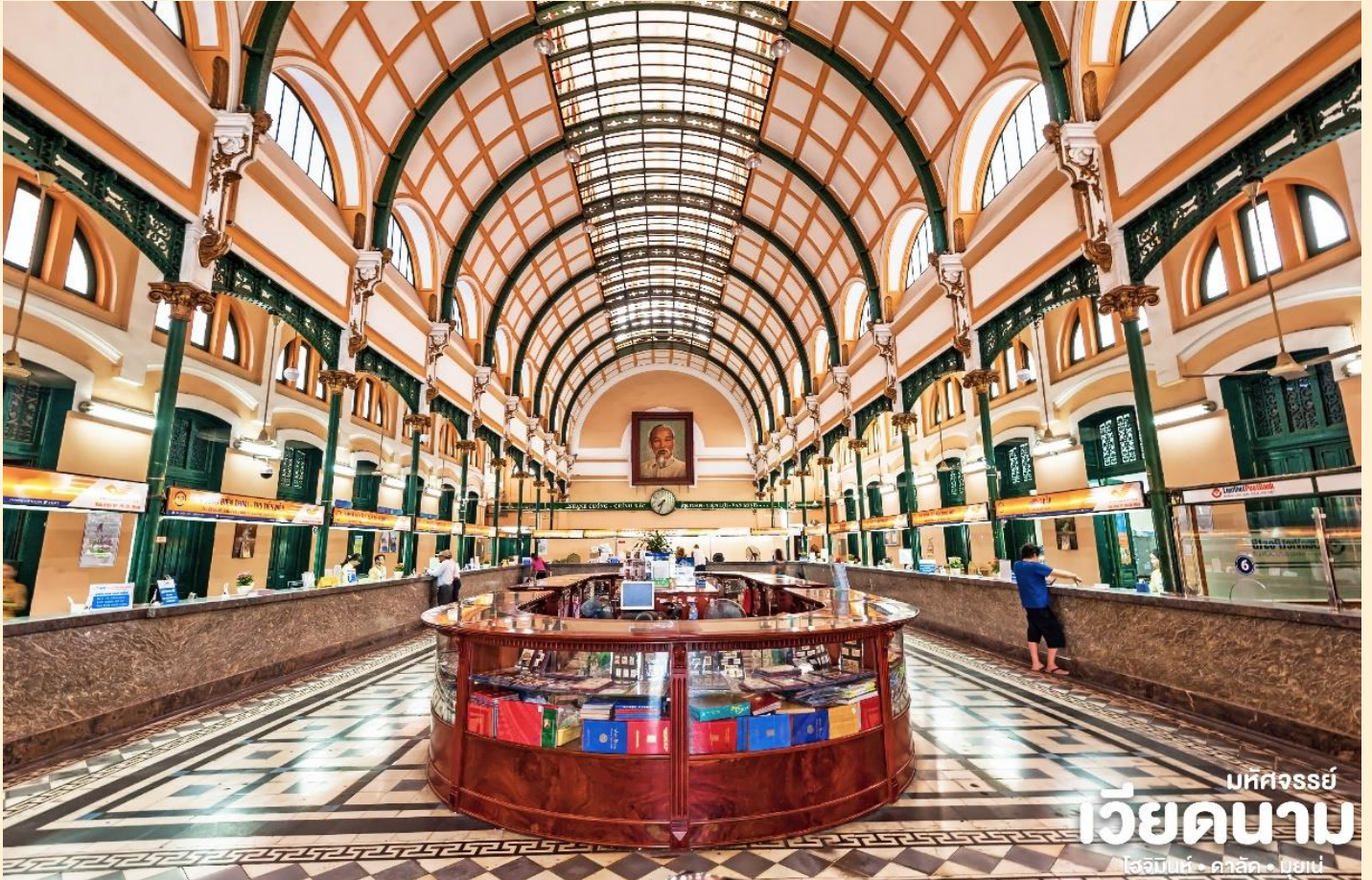
บทความ เวียดนาม โฮจิมินห์ • ฮานอย • ฮอยอัน

โทรศัพท์ : 042-246662 / 086-4515274 E-mail : journeyticket@hotmail.com