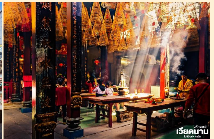
บทความ เวียดนาม โฮจิมินห์ • ฮานอย