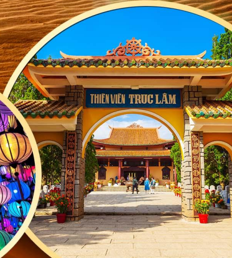
วัดตักลับ