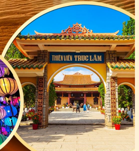
วัดตักลิ้ม