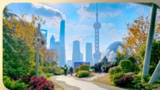
สวนนอร์กบันด์