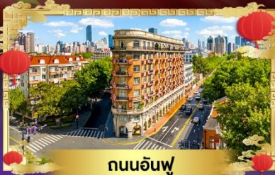
ถนนอันฟู