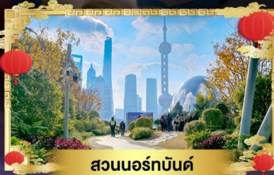
สวนนอร์กบันด์