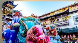
ตลาดร้อยปีเงินหวังเหมี่ยว