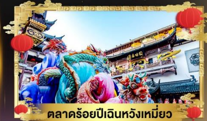
ตลาดร้อยปีเงินหวงเหม่มียง