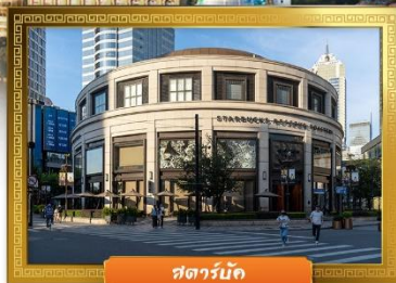
สตาร์บัค

☑️ ช้อปปิ้ง POP MART ถ่ายรูปคู่กันดื่มยักซ์