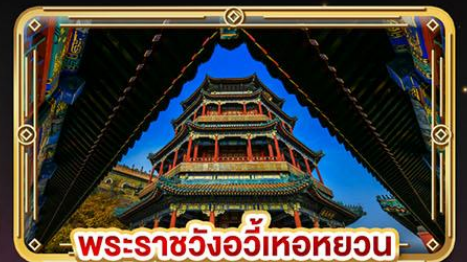
พระราชวังอวิหะทยวน