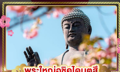
พระใหญ่อุซึคุโดบุตสึ