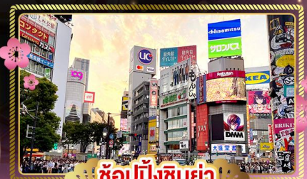
ช้อปปิ้งชิบูย่า