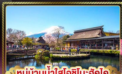
หมู่บ้านน้ำใสโอชิโนะฮักไต