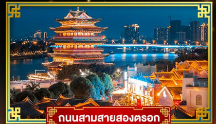
ถนนสามสายสองครอก