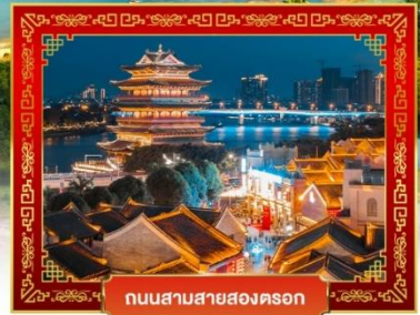
ถนนสายสองตอกล