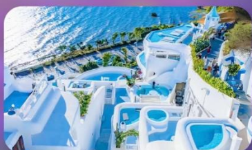
ซาโตรินี่