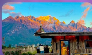
คาเฟ่ Yun Ti Yang