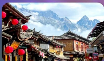
เมืองโบราณซาซี