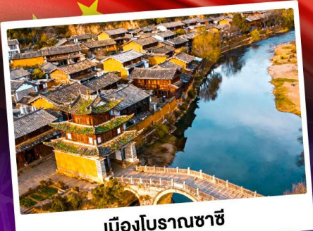
เมืองโบราณซาซี

ชมดอกไม้บานสะพรั่งทั่วยูนนาน "เซ็ดอันดาเฟี้ยวสุดอลัง"