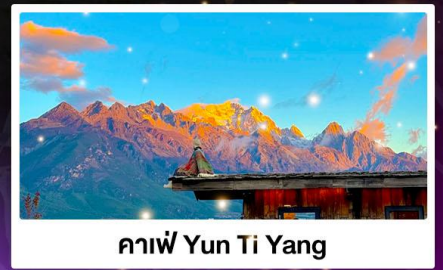
กาแฟ Yun Ti Yang

🚄 บริการรถไฟ ความเร็วสูง ฟรี! รถขบวนพิเศษ