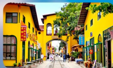
หมาหยวนมิเอตร์เกจ