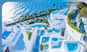
ซาโตรินี่