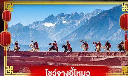
โซ่วจางอ๋อโหม่ว