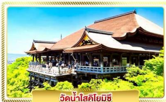
วัดน้ำใสคิโยมิสึ