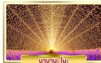
นาบานะ โนะ