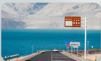
ทะเลสาบไป่ซาหู