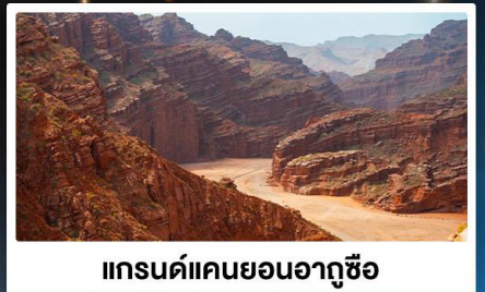
แกรนด์แคนยอนอาวูชือ