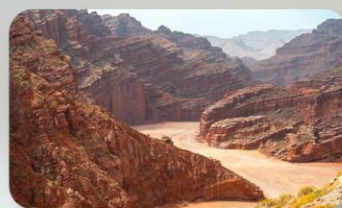
แกรนด์แคนยอนอาตุซือ