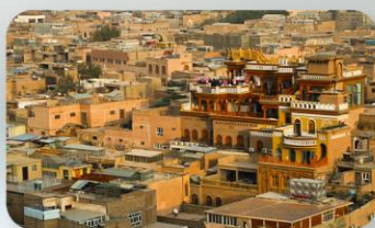
เมืองเก่าคัชการ