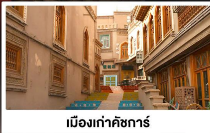
เมืองเก่าคัชการ์