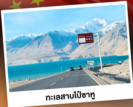
ทะเลสาบไปซาทุ