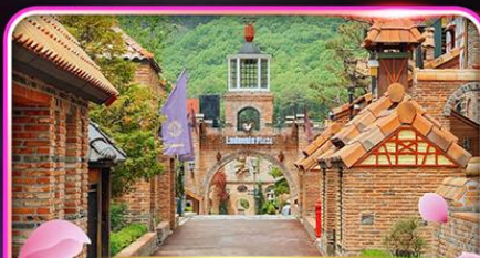
Ludensia Theme Park