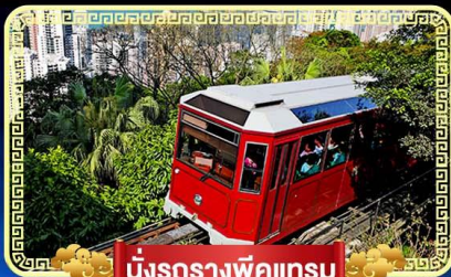
นั่งรถรางพิกแกรม

นั่งกระเช้ามองปิง 360 องศา บินลัดฟ้าไปมู..สู่เกาะฮ่องกง