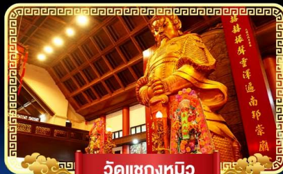
วัดเข่งทมิฬ