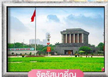
จัตุรัสบาตัญญู