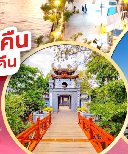
วัดหังอกเซิน