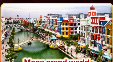
Mega grand world