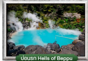
บ่อน้ำ Hells of Beppu