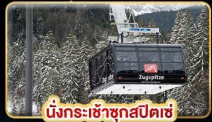
นั่งกระเช้าซูกสปีทซ์

บินทรู Full Service น้ำหนักกระเป๋า 25 kg.