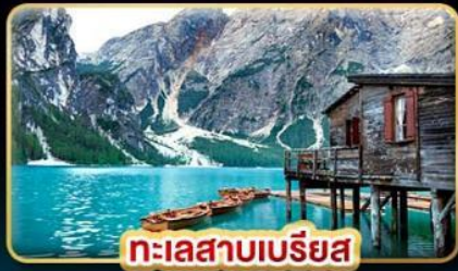
ทะเลสาบเบรียส