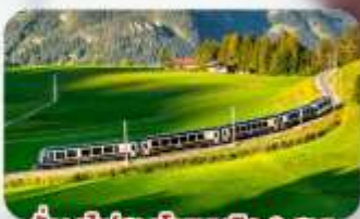
นั้งรถไฟสายโรเมนดิก 2 สาย Golden Pass / Luzern Interlaken Express