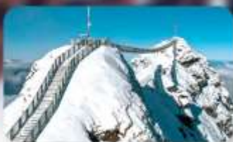
พิชิต 3 ยอดเขาดัง Rigi / Schilthorn / Glacier 3000