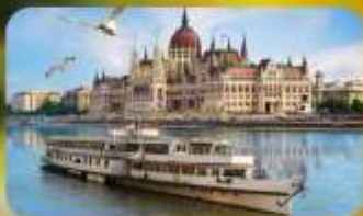
ส่งเรือแม่น้ำดานูบ พร้อมจิบแชมเปญ