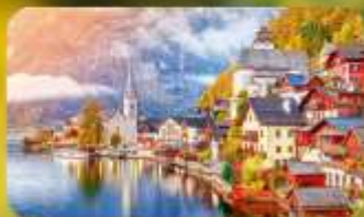
การันตีพัก Hallstatt / St. Wolfgang หรือริบทะเลสาบ 1 คืน