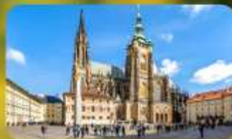
เข้าชม 2 ปราสาท ปราก และเซินบรุนน์