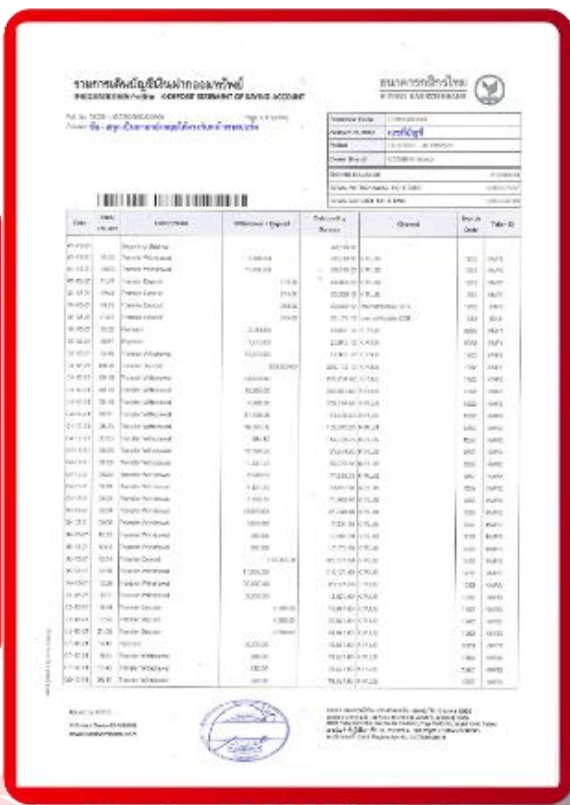
ตัวอย่าง Bank Statement ที่ผู้สมัครต้องขอจากธนาคาร

3.4 ปรับสมุดบัญชีธนาคารตัวจริง และเตรียมไปในวันที่ยื่นวีซ่า