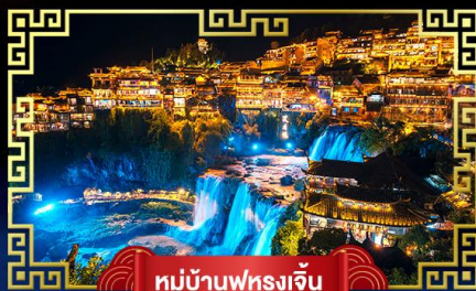
หมู่บ้านฟูรงเจิน