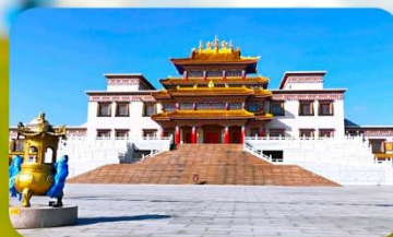
คฤหาสน์พุทธบูชาแห่งชีวิตอุทยาน