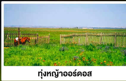
ทุ่งหญ้าออร์ดอส