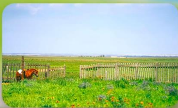
ทุ่งหญ้าออร์ดอส