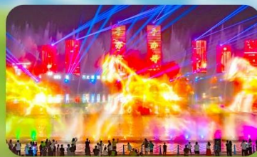
น้ำพุดนตรีคังปาสือ