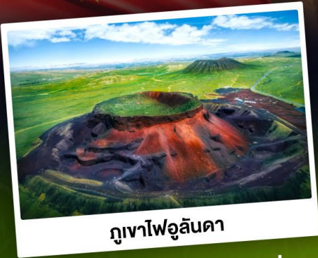
ภูเขาไฟอูลันดา

ท่องเที่ยวแดนแห่งทะเลทรายและทุ่งหญ้า ชมพระอาทิตย์ขึ้นทุ่งหญ้าออร์ดอส