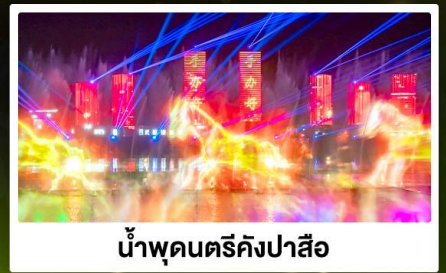
น้ำพุดนตรีคังปาสือ