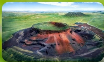
ภูเขาไฟอูลันดา