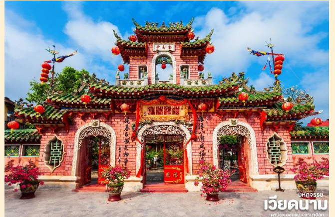
นำชม Old House of Tan Sky บ้านโบราณ

นำท่านชม วัดจีน เป็นสมาคมชาวจีนที่ใหญ่และเก่าแก่ที่สุดของเมืองฮอยอันซึ่งเป็นที่พักปะของชนหลายรุ่น วัดนี้มีจุดเด่นอยู่ที่งานไม้แกะสลักลวดลายสวยงามท่านสามารถทำบุญต่ออายุโดยพิธีสมัยโบราณคือการนำรูปที่ขุดเป็นกันหอย มาจุดทิ้งไว้เพื่อ เป็นสิริมงคลแก่ท่าน