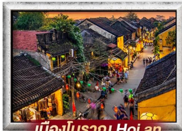
เมืองโบราณ Hoi an