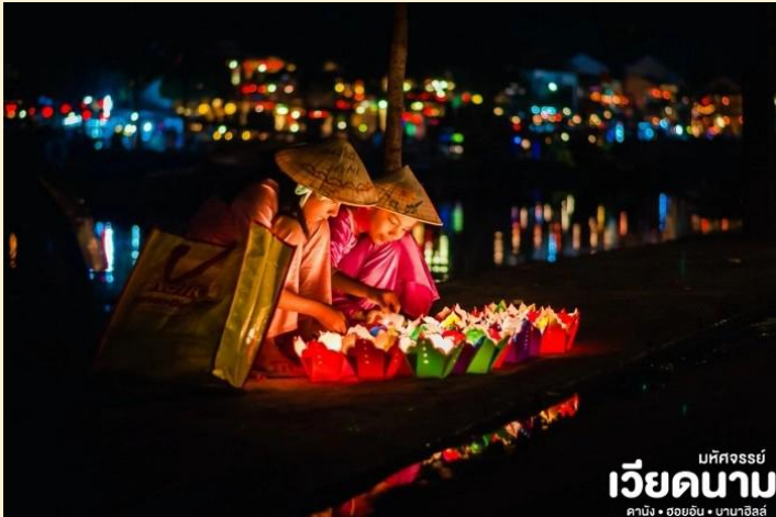
บัทจอร์นีย์ เวียดนาม คาบัง • ฮอยอัน • นานาฮือล์

โทรศัพท์ : 042-246662 / 086-4515274 E-mail : journeyticket@hotmail.com