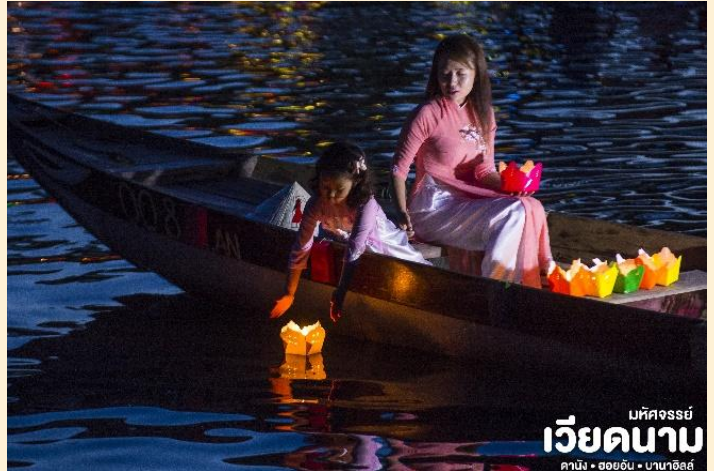
บัทจอร์นีย์ เวียดนาม คาบัง • ฮอยอัน • นานาฮือล์

ที่พัก เข้าสู่ที่พัก TTC HOI AN 4* หรือเทียบเท่ามาตรฐานเวียดนาม