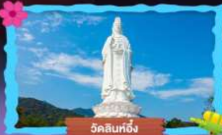
วัดลินท็อง