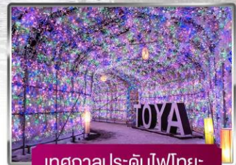
เทศกาลประดับไฟไทยะ